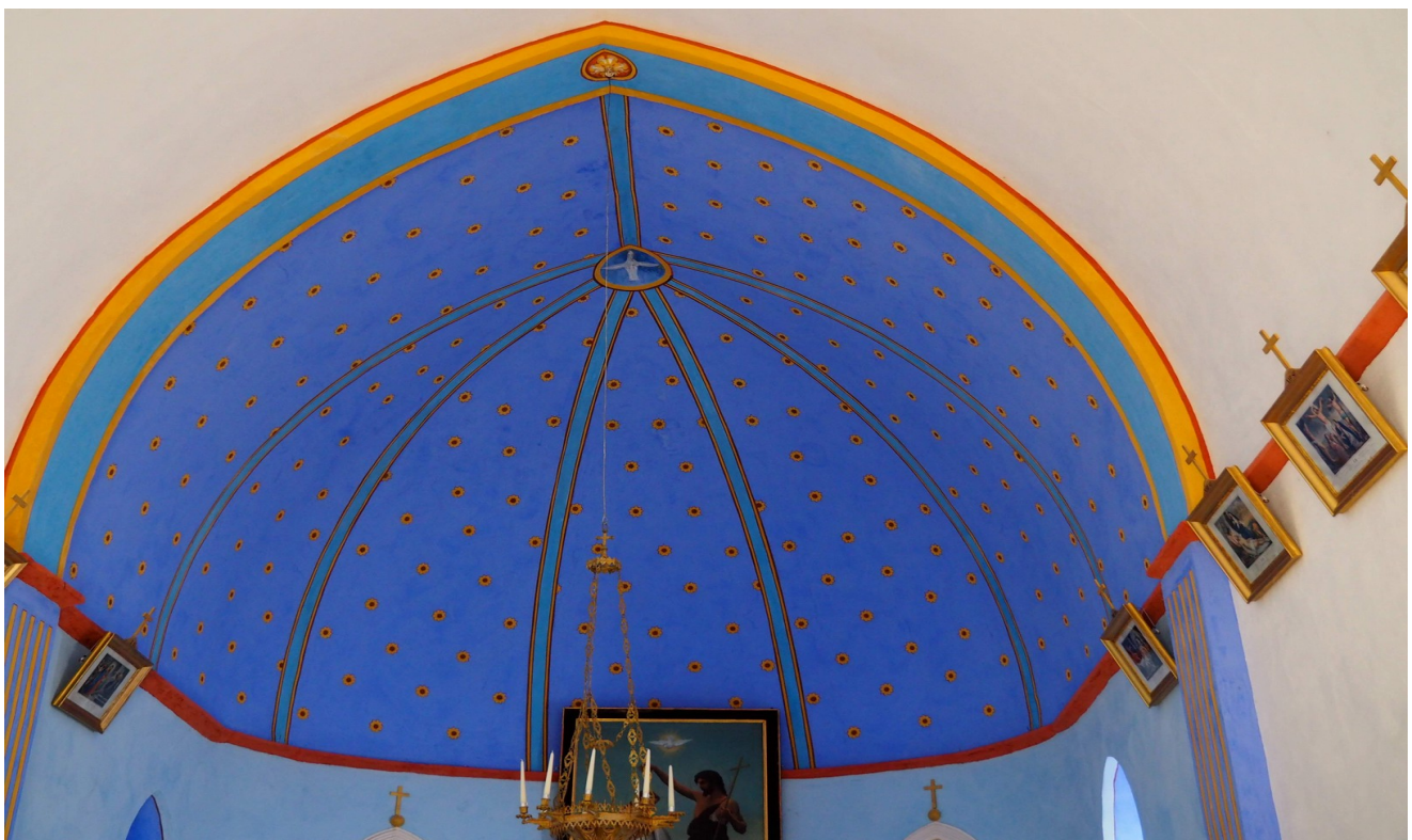
Les peintures de la chapelle restaurées

Né en Italie, Vincenzo PECCI assure les fonctions de camerlingue, en remplacement du pape Pie IX, décédé en 1877 et est élu pape sous le nom de Léon XIII en février 1878. IL règne jusqu'à sa mort en 1903. Il est enterré au Vatican.