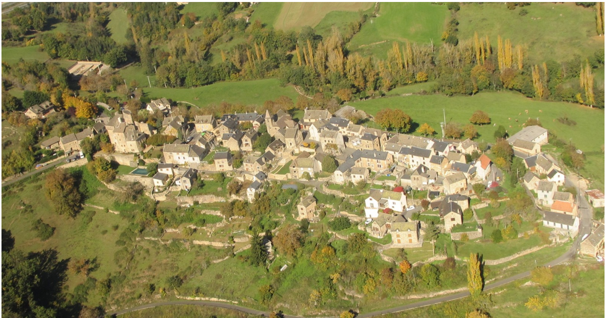
Montjézieu vu du ciel

Une maison ancienne au centre du village, très ancienne et à cachet particulier porte vulgairement le nom de synagogue. Beaucoup de noms de lieux et même de personnes juifs : Salmon, Booz, probablement Imbèque et Reilles, etc, Sara, Elie, Alla, etc.